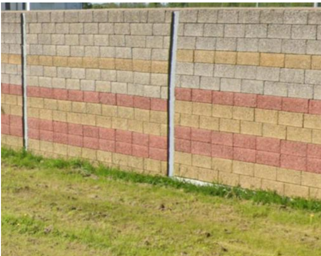
8 pav. Triukšmo sienų vidinė betono ir blokelių apdaila

Prašome nurodyti, kurį triukšmo sienos vidinės apdailos variantą tiekėjas turi įsivertinti savo pasiūlyme.