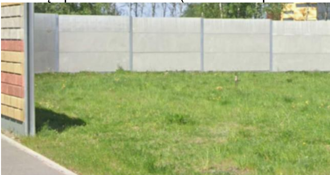
7 pav. Triukšmo sienų vidinė betono ir blokelių apdaila

Pirkimo dokumentacijoje pateiktoje techninio darbo projekto statinio architektūrinėje dalyje aiškinamajame rašte paveikslėliuose Nr. 7 bei Nr. 8 pateikti du skirtingi triukšmo sienų vidinės betono ir blokelių apdailos variantai (su betono apdaila be blokelių vaizdo ir su su blokelių apdaila):